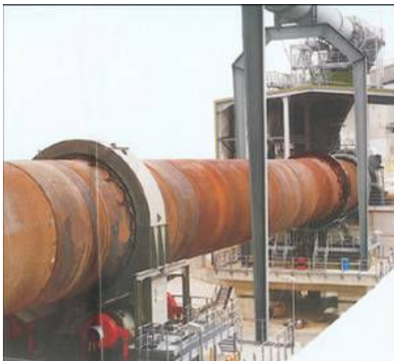
Figura 3 Horno de Hierro Esponja

Para efectuar esta reducción directa, se utilizan grandes hornos tubulares con alimentación conjunta de estos dos materiales y aporte térmico para manejar las condiciones termodinámicas adecuadas en el interior del horno ( Figura 3 )