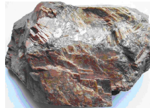
Figura 2 De pellets a Hierro Esponja

Para efectuar esta reducción directa, se utilizan grandes hornos tubulares con alimentación conjunta de estos dos materiales y aporte térmico para manejar las condiciones termodinámicas adecuadas en el interior del horno ( Figura 3 )