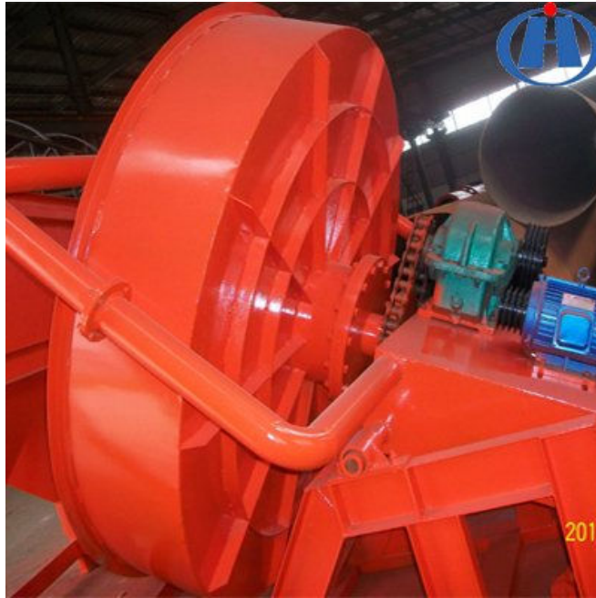
Figura 4 Tambor Pelletizador